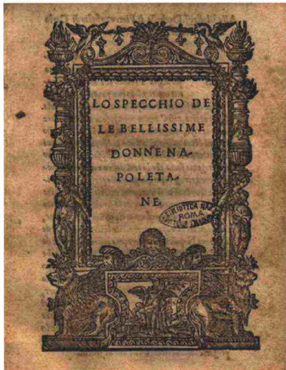
Jacomo Beldando, Lo specchio de le bellissime donne napoletane , Napoli 1536

periodo risale la pubblicazione di importanti opere, tra cui due trattati sulla concezione dell'eucarestia, le Prediche nomate Labirinti del libero o ver servo arbitrio (dedicate alla regina Elisabetta I d'Inghilterra) e il Catechismo o vero Institutione Christiana . I buoni rapporti con la chiesa zurighese e il suo Antistes Heinrich Bullinger furono però guastati dalla pubblicazione dei Dialogi XXX , un'opera complessa, di difficile interpretazione. A destare scandalo furono soprattutto le posizioni espresse in materia trinitaria e matrimoniale, giudicate eterodosse da una apposita commissione di pastori. Nell'inverno del 1563 il consiglio di Zurigo espulse dalla città l'ultrasettantenne Ochino sotto l'accusa – forse strumentale – di eresia, costringendolo così all'ennesimo esilio.