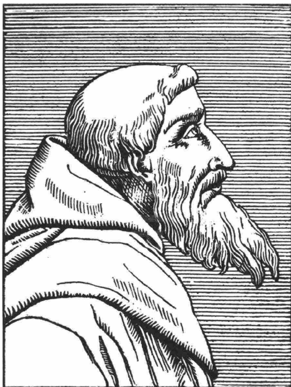
Bernardino Ochino in una incisione del secolo XVI

Siena nel 1487. Entrò giovanissimo nell'Ordine dei francescani osservanti e passò nel 1534 a quello dei Cappuccini, di cui fu eletto vicario generale nel 1538, carica a cui venne riconfermato nel 1541. Ochino fu presto riconosciuto come uno dei più efficaci predicatori della penisola che percorreva in lungo e in largo per rispondere alle numerosissime richieste delle autorità religiose e civili. Come Vermigli, anch'egli a Napoli strinse forti legami con il circolo degli "spirituali" raccolti intorno alla carismatica figura di Juan de Valdés. Dal 1539-40 in avanti i suoi sermoni furono incentrati sul tema valdesiano del "beneficio di Cristo". E non a caso da quell'anno cominciarono ad affiorare le difficoltà con i padri Teatini, che sollevarono dubbi sull'ortodossia della predicazione di Ochino. Per qualche tempo, imponendosi l'autocensura ( "parlare di Christo mascherato" ) fu in grado di schivare gli attacchi, ma nell'estate del 1542 temendo una incriminazione per eresia da parte dell'Inquisizione, scelse di lasciare l'Italia assieme a Vermigli. Mentre l'ex priore si volse senza esitazione verso Zurigo, l'ex vicario generale trovò rifugio temporaneo a Ginevra.