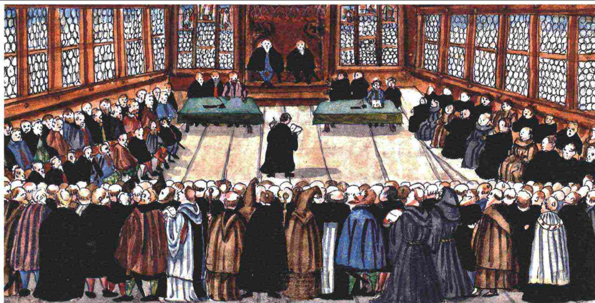
Prima Disputa di Zurigo (29 gennaio 1523)

(Disegno a penna colorato da: Heinrich Thomman, Abschrift von Heinrich Bullingers Reformatiionsgeschichte, c. 1600)